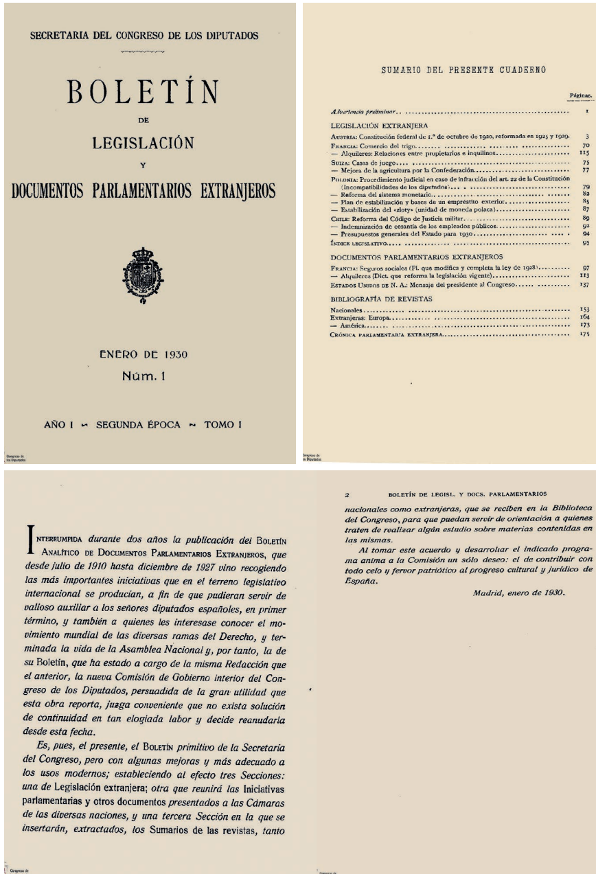
Imagen 3: Página inicial, Sumario del presente cuaderno y presentación del primer boletín de la II Época, de enero de 1930, con la nueva denominación, Boletín de Legislación y Documentos Parlamentarios Extranjeros . Como dice la presentación, estaba a cargo de su redacción la Comisión de Gobierno interior del Congreso de los Diputados.