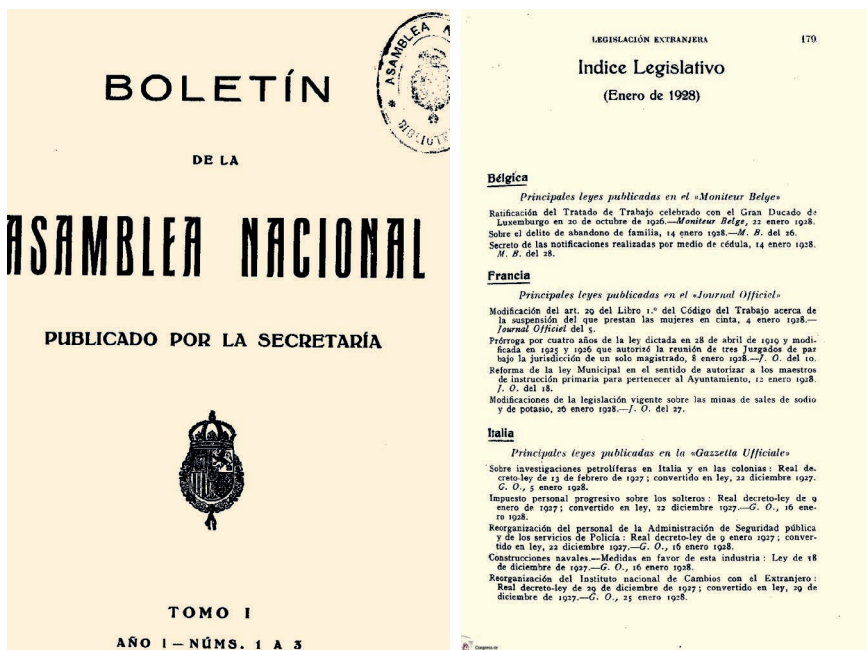
Imagen 2: Páginas 1 y 179 de los tres primeros números del Boletín de la Asamblea Nacional , de enero de 1928. Se mantiene, en esencia, la estructura y la presentación del Boletín de la Época anterior, pero el Índice se incluye al final.