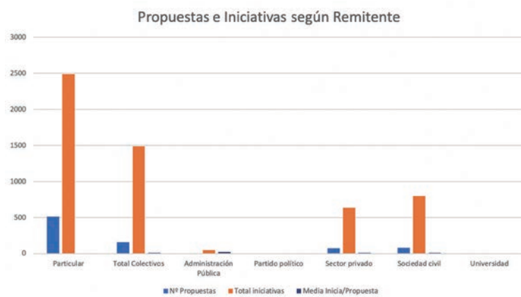
Gráfico 2. Propuestas, iniciativas y media de iniciativas por tipo de actor

76%, se corresponden con iniciativas presentadas por una persona, frente a las 161, 24%, formuladas por organizaciones o colectivos. Sin embargo, esta proporción se compensa bastante cuando hablamos del número de iniciativas presentadas por unos y otros. En este punto, solo el 63 % (2485) de las iniciativas tendrían origen en propuestas individuales, una media de 4,9 iniciativas por cada propuesta, mientras que el 37 % (1487) vendrían de las 161 propuestas colectivas, con una media de 9,2 iniciativas por propuesta. Las organizaciones y grupos muestran así tener una agenda propia dentro de un sector, o tema de interés, que les lleva a acumular distintas iniciativas en cada una de sus propuestas.