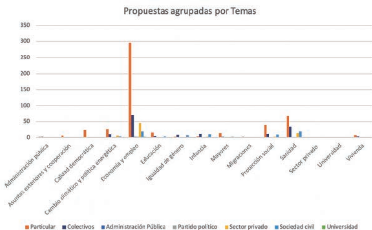
Gráfico 4. Propuestas e iniciativas agrupados por temas

En el reparto de estos temas entre los distintos proponentes, llama la atención como, entre los particulares, los temas más importantes, por encima de su media de propuestas (76,38%), son economía, calidad democrática, asuntos exteriores, educación y mayores (>77%). Entre la sociedad civil, destacan ampliamente los temas de igualdad de género (70 %) e infancia (62,5 %), seguidos por sanidad (19,6%), protección social (17,3 %) y educación (18,2%), todos por encima de su propia media (11,4%). Por último, el sector privado, con un número similar de propuestas (11 %), se concentra en temas de cambio climático (16,2%) y sanidad (13,7%) y se sitúa en la media en mayores (12,5%) y economía y empleo (12,26%).