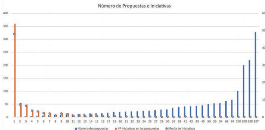
Gráfico 1. Propuestas, iniciativas y media de iniciativas por propuesta

De las 670 propuestas recibidas, más de la mitad (52%) incluían más de una iniciativa. De esta manera, se recibieron 3972 iniciativas, repartidas de la siguiente manera 52 .