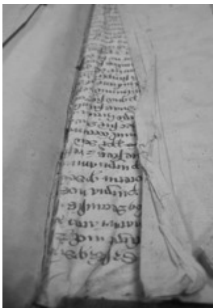
Ejemplo de reutilización de pergamino en encuadernación-

su encuadernación un pergamino de origen desconocido redactado en letra gótica de buena factura y en dos tonalidades de tinta, un posible “ membra disiecta ” documental(3) a la espera de la valoración del mismo tras la próxima restauración del volumen.