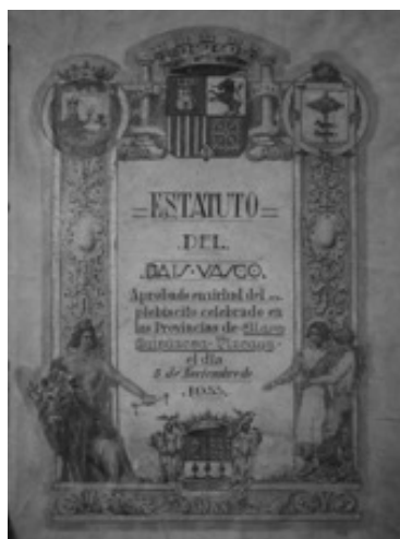
Primera página de la Constitución Española 1931 (izquierda) y Portada del Estatuto Vasco de 1933 (derecha) ambas realizadas en pergamino

Otra de las secciones de gran interés para el estudio de la administración parlamentaria, es la sección de “ Gobierno Interior ” (1810-hasta la actualidad). Esta sección recoge toda la documentación generada por las distintas unidades y dependencias de la Cámara transferidas al Archivo. Son en su mayoría expedientes de carácter administrativo en materia de personal, presupuesto de la Cámara e infraestructuras.