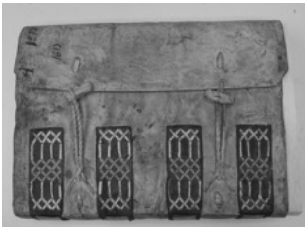
Ejemplo de típico de encuadernación con ornamentación perteneciente al Fondo Cortes de Castilla-

rías mudéjares realizadas por cintas de cuero. Igualmente destacable es el uso de broches en la solapa para conseguir un perfecto cierre ante la dureza del pergamino(2).