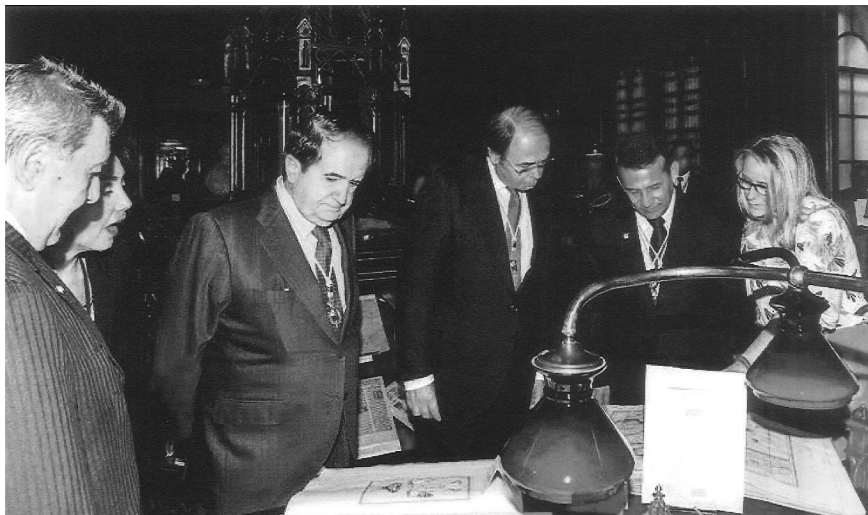
Núm. 4. Visita de S.E. Ollanta Moisés HUMALA TASSO, Presidente de la República de Perú, el 8 de julio de 2015