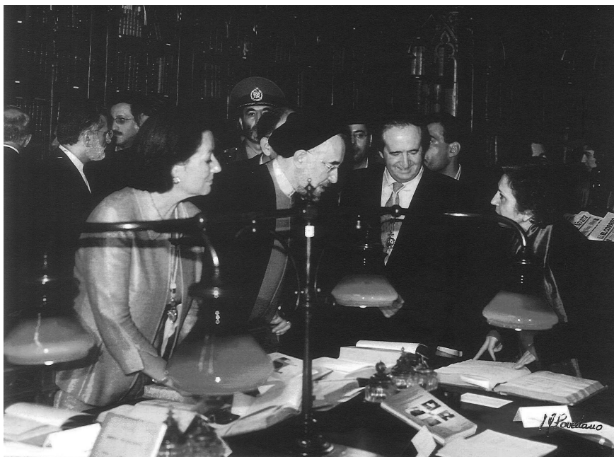
Núm. 2. Visita de S.E. Mohammad Khatami. Presidente de la República Islámica de Irán. (30 de octubre de 2002)