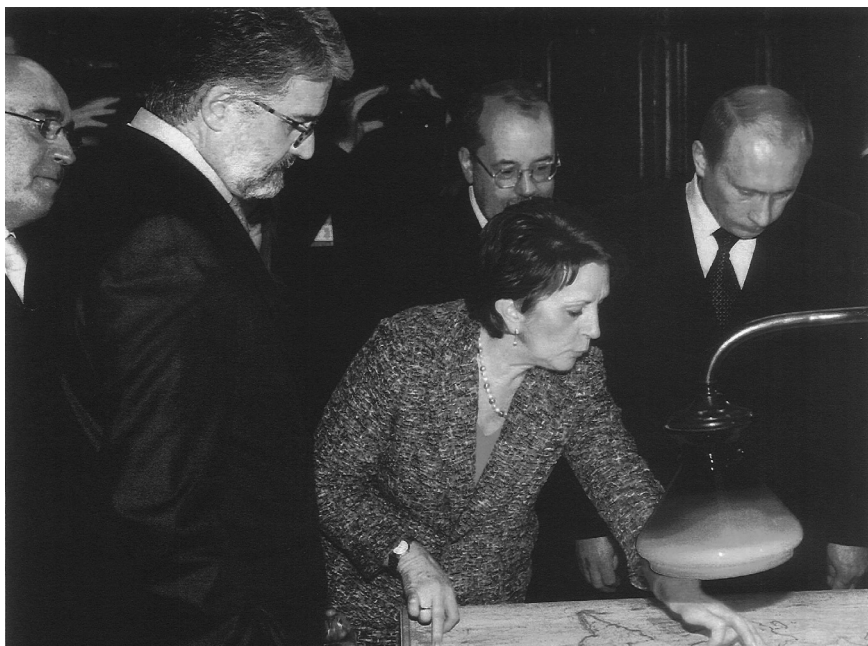
Núm. 3. Visita de S.E. Vladimir PUTIN. Presidente de la República de Rusia. (9 de febrero de 2006)