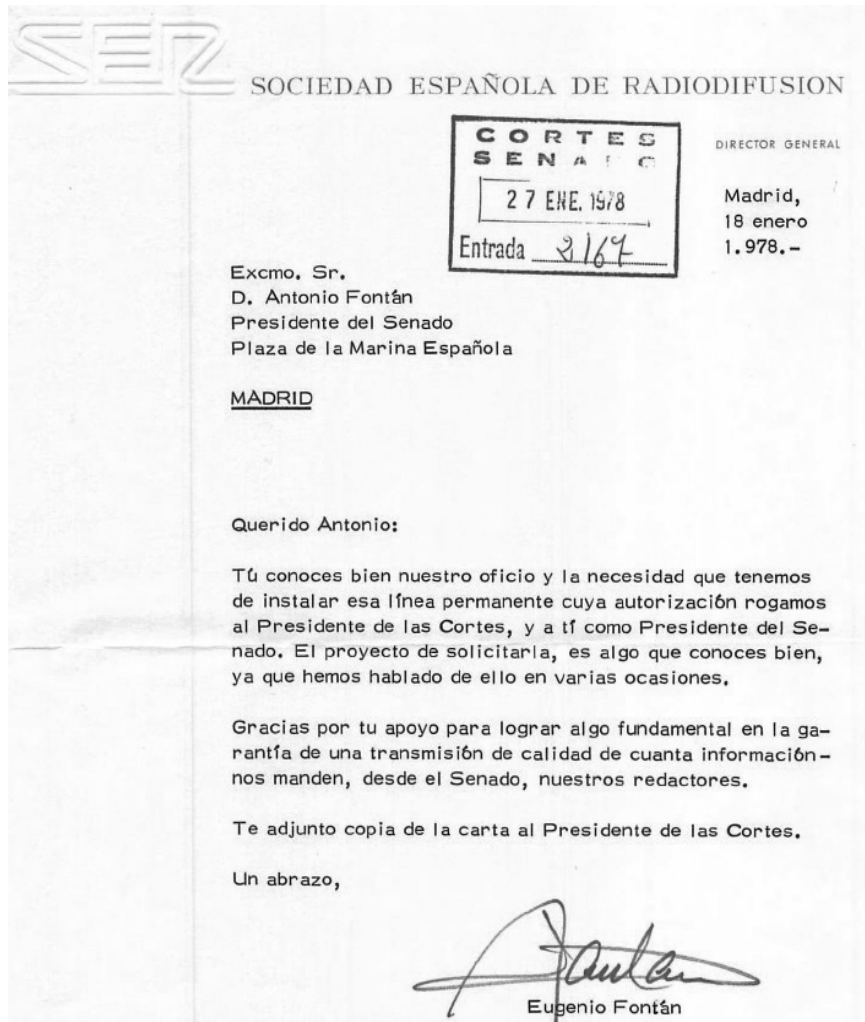
Carta dirigida por Eugenio Fontán al presidente del Senado 5